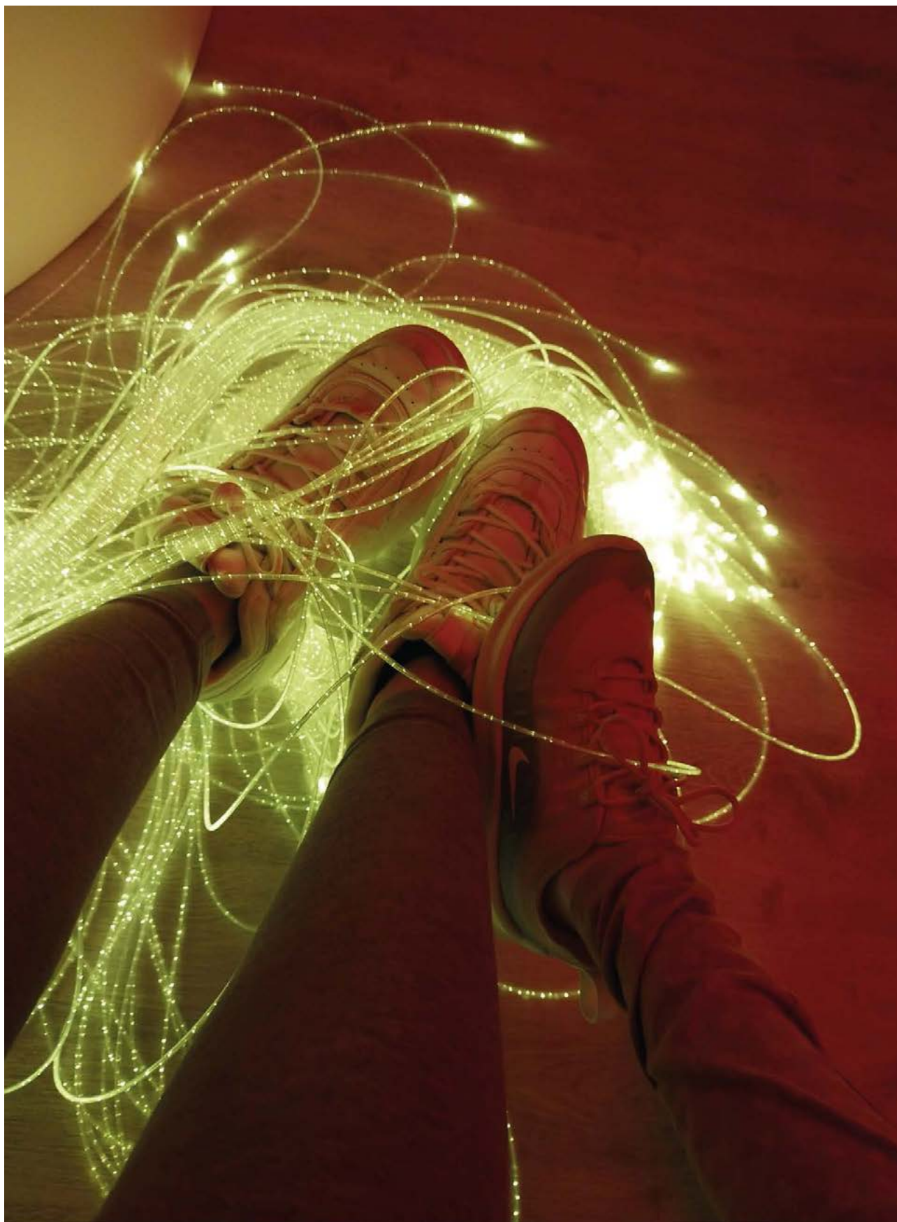
Imatge de l'aula d'estimulació multisensorial de l'escola d'educació especial Nostra Senyora del Mar.