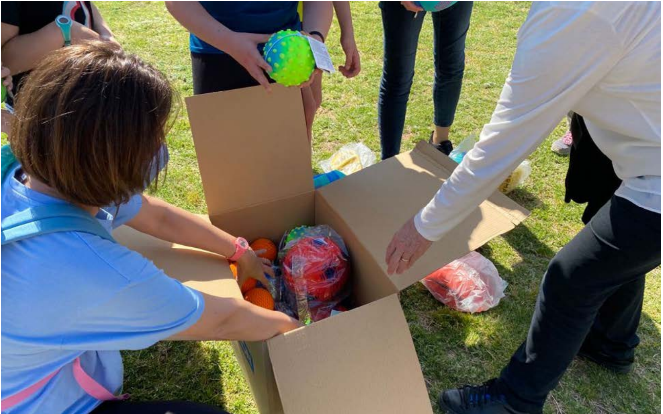
Membres de l'Associació Supera't amb el material que van rebre gràcies a l'ajut entre la Fundació Reddis i la Fundació la Caixa.