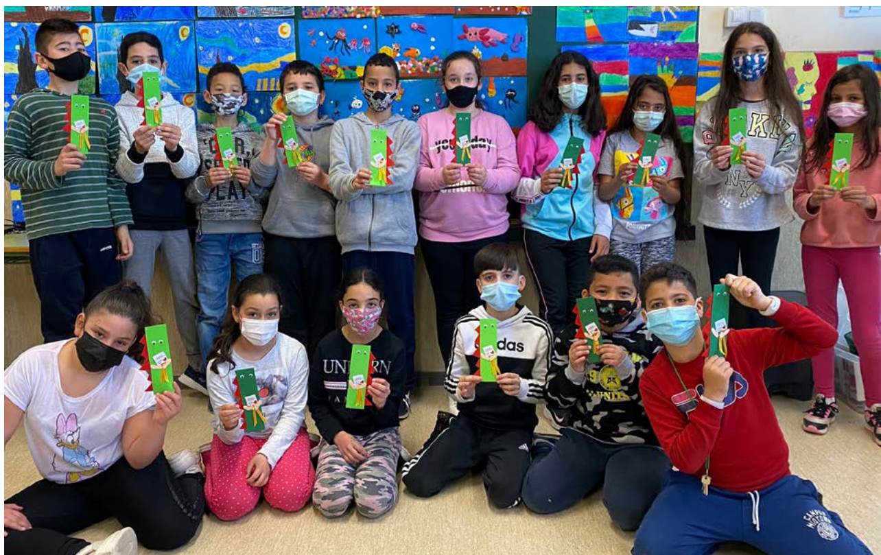
Alumnes de l'escola Sant Bernat Calvó que participen en el projecte I tu, de petit@, a què jugaves?