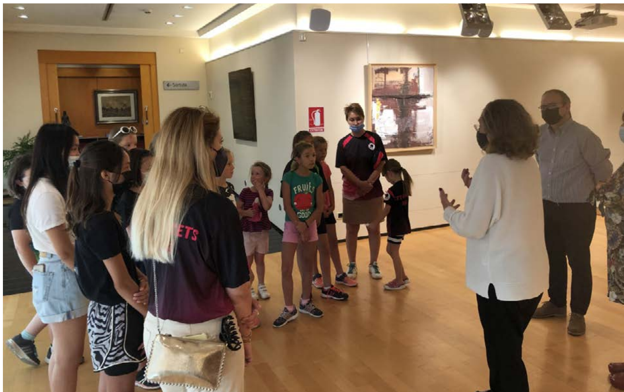
La presidenta de la Fundació Reddis rebent els alumnes i representants del Club Tennis Taula Ganxets de Reus.