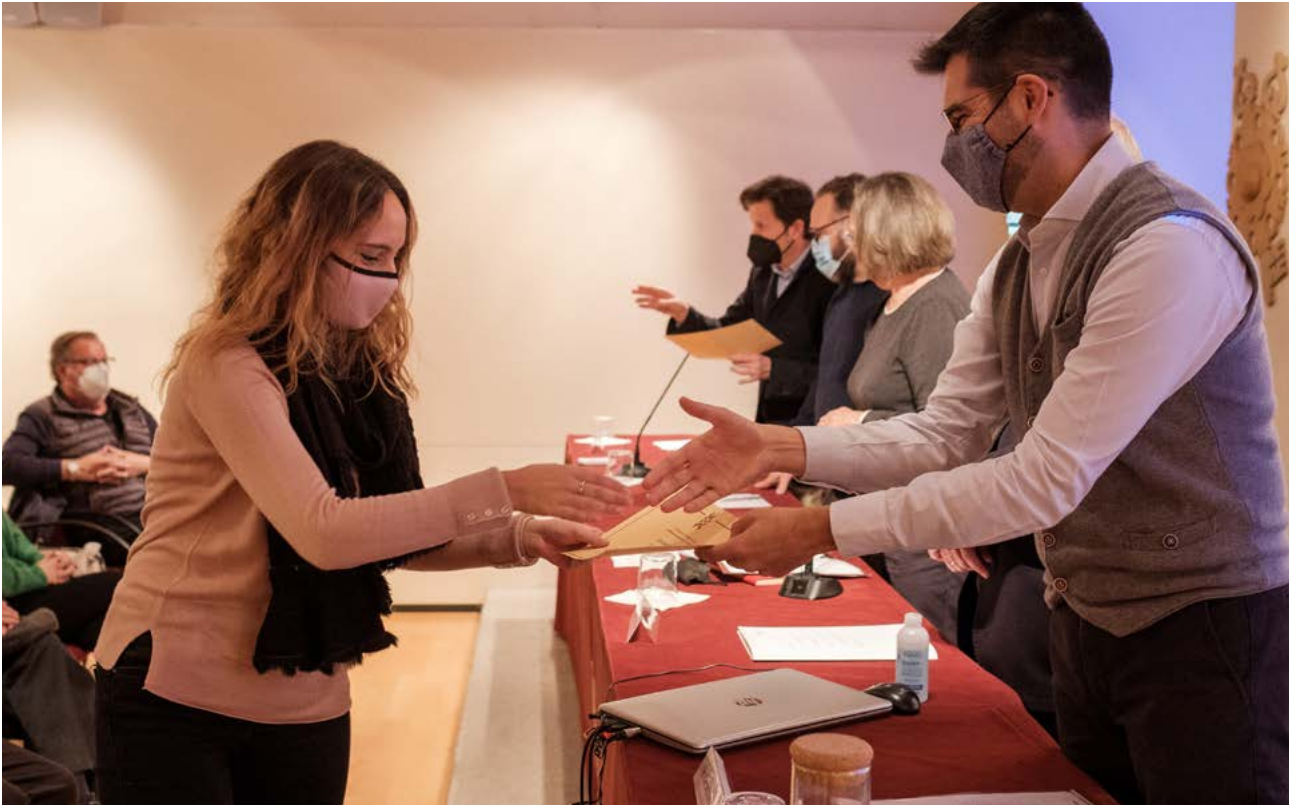
Acte de lliurament de les beques de mobilitat als estudiants de la Facultat d'Economia i Empresa de la URV.