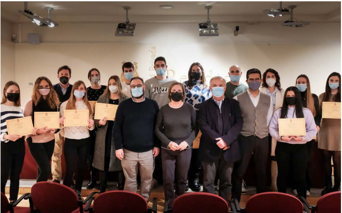
Acte de lliurament de les beques de mobilitat als estudiants de la Facultat d'Economia i Empresa de la URV.