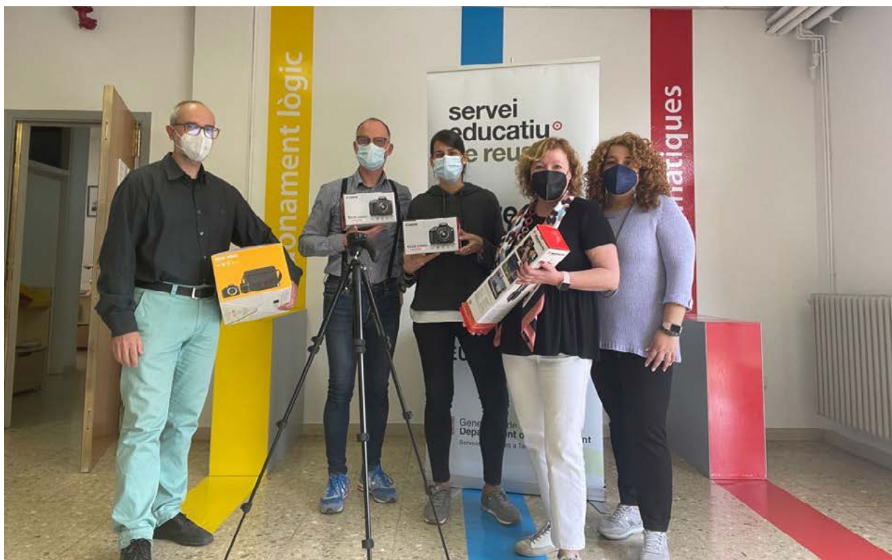
L'equip del Centre de Recursos Pedagògics del Baix Camp amb el material adquirit gràcies a la subvenció.