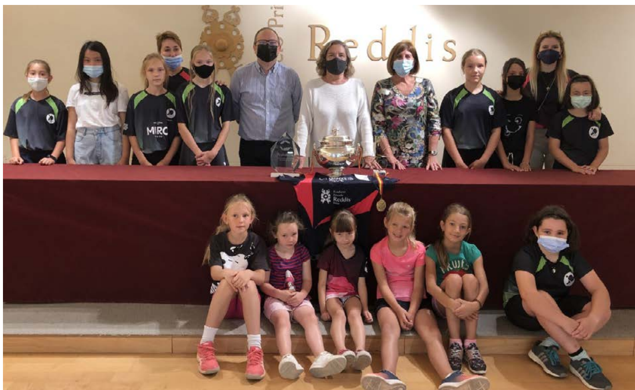
Els alumnes i responsables del Club Tennis Taula Ganxets de Reus compartint les seves copes i medalles amb alguns dels membres de la Fundació Reddis.