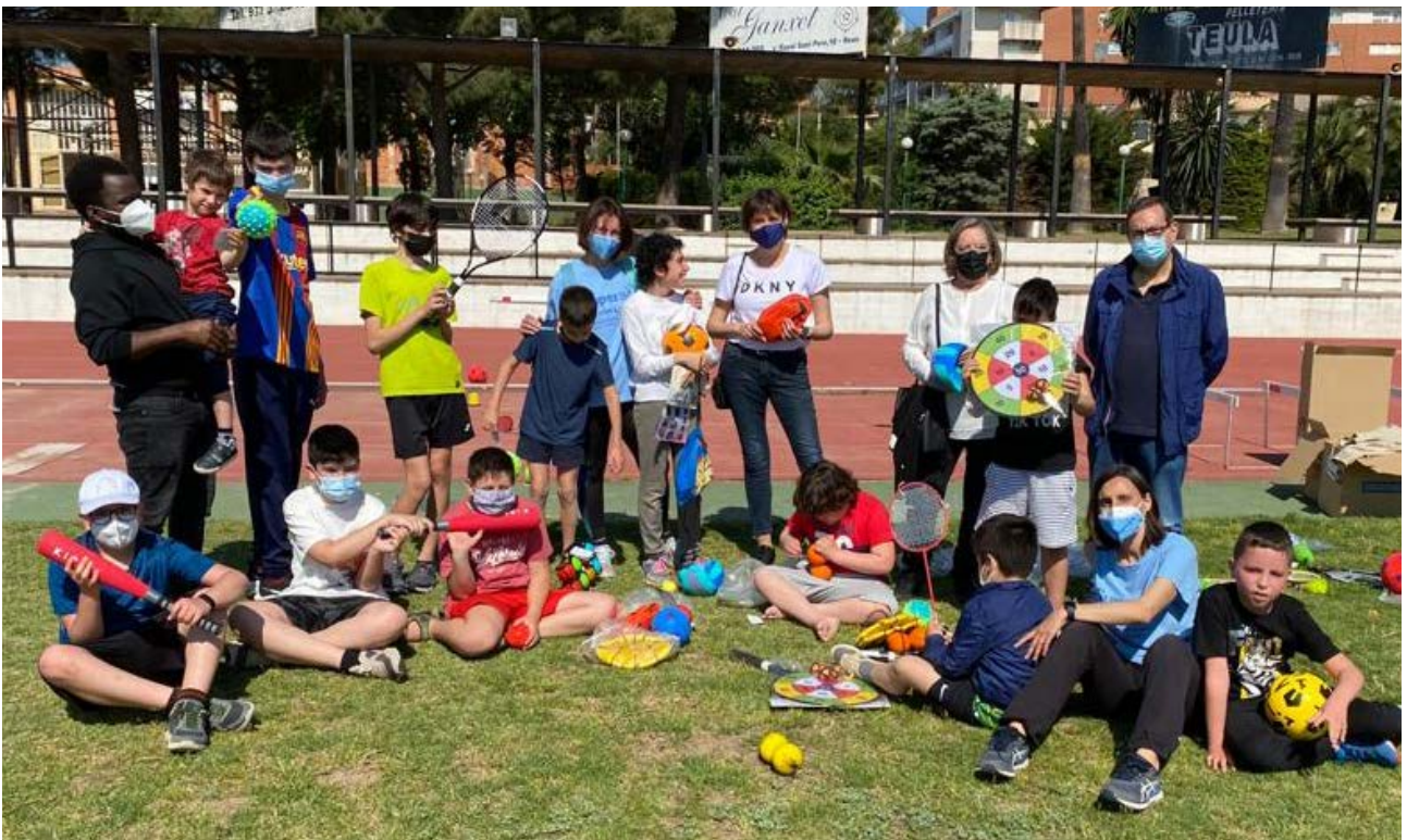
Membres de l'Associació Supera't amb el material que van rebre gràcies a l'ajut entre la Fundació Reddis i la Fundació la Caixa.