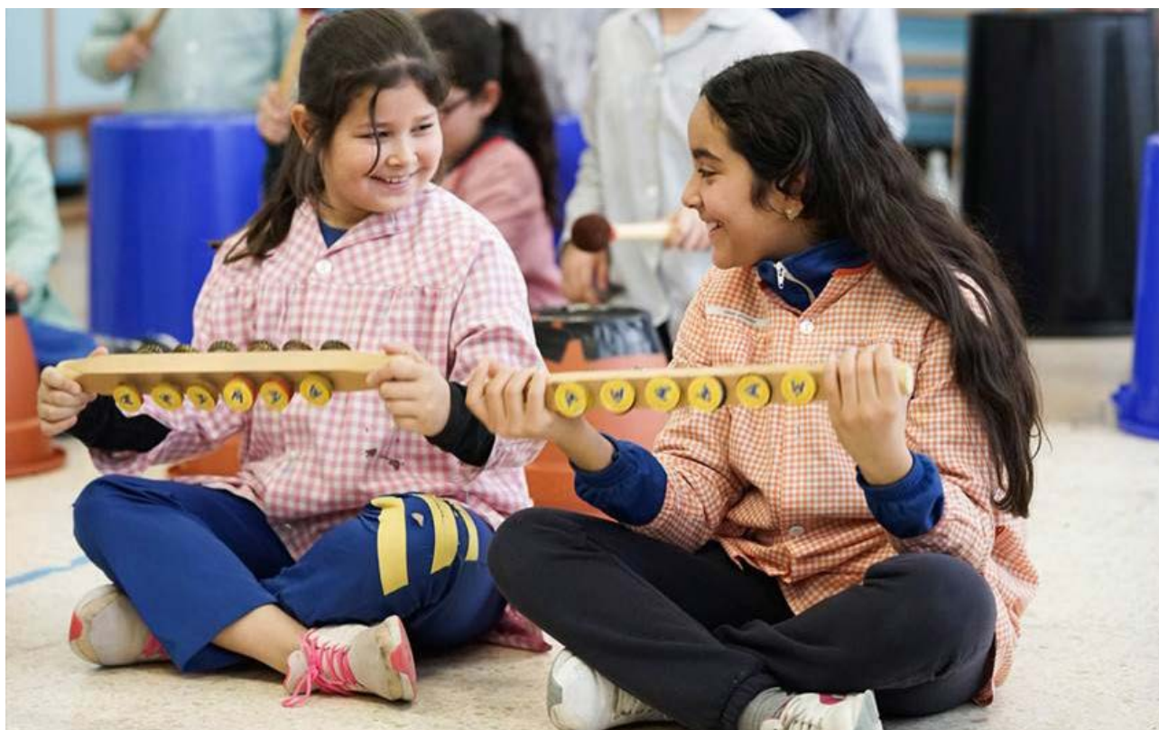
Dalt i baix, alumnes de les escoles de la ciutat fent el projecte Territori Viu , de Còdol Educació.