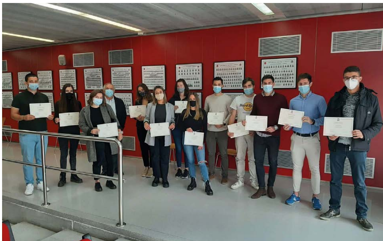
Lliurament de les beques Erasmus als alumnes de la Facultat d'Economia i Empresa de la URV.