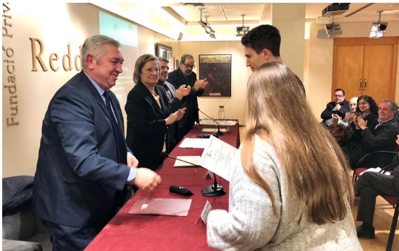
Lliurament dels Premis als treballs de recerca de Batxillerat i als treballs de projecte de Formació Professional.