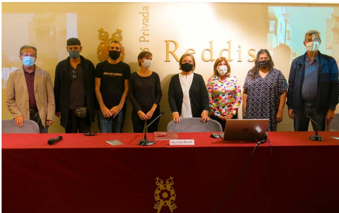
Finalistes del I Premi Beca d'Art Contemporani de la Fundació Privada Reddis, juntament amb el president i el secretari del Premi i la presidenta de la Fundació.