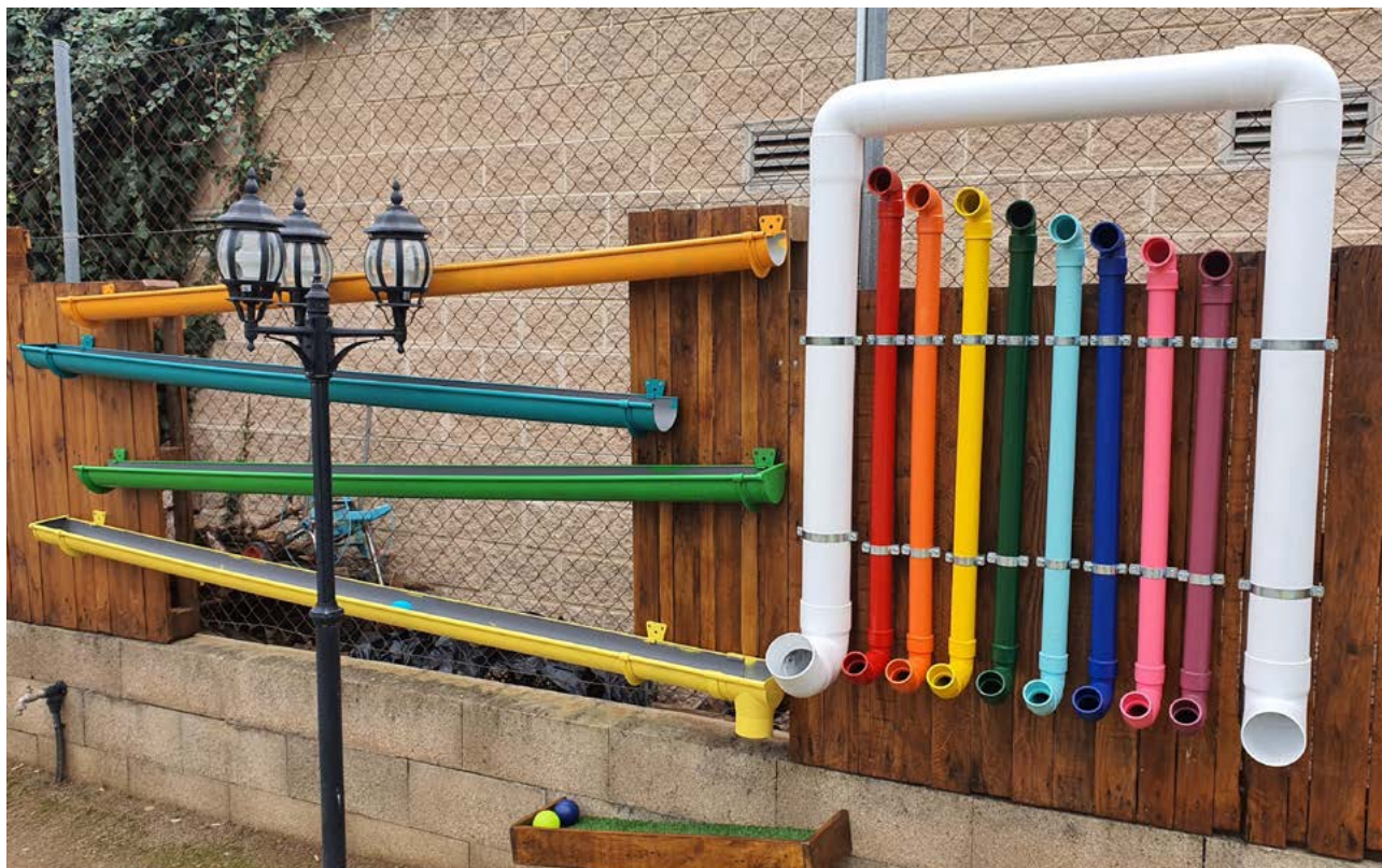
Jardí sensorial del Taller Baix Camp.