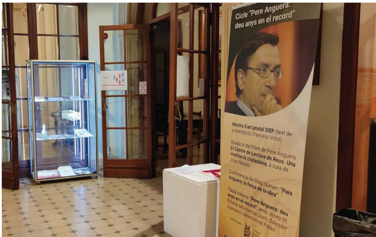
Memorial Pere Anguera: deu anys en el record , al Centre de Lectura.