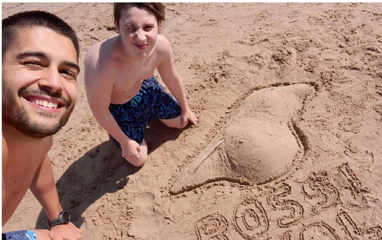
Una de les parelles de mentoria del projecte Rossinyol de l'Associació Quilòmetre Zero.