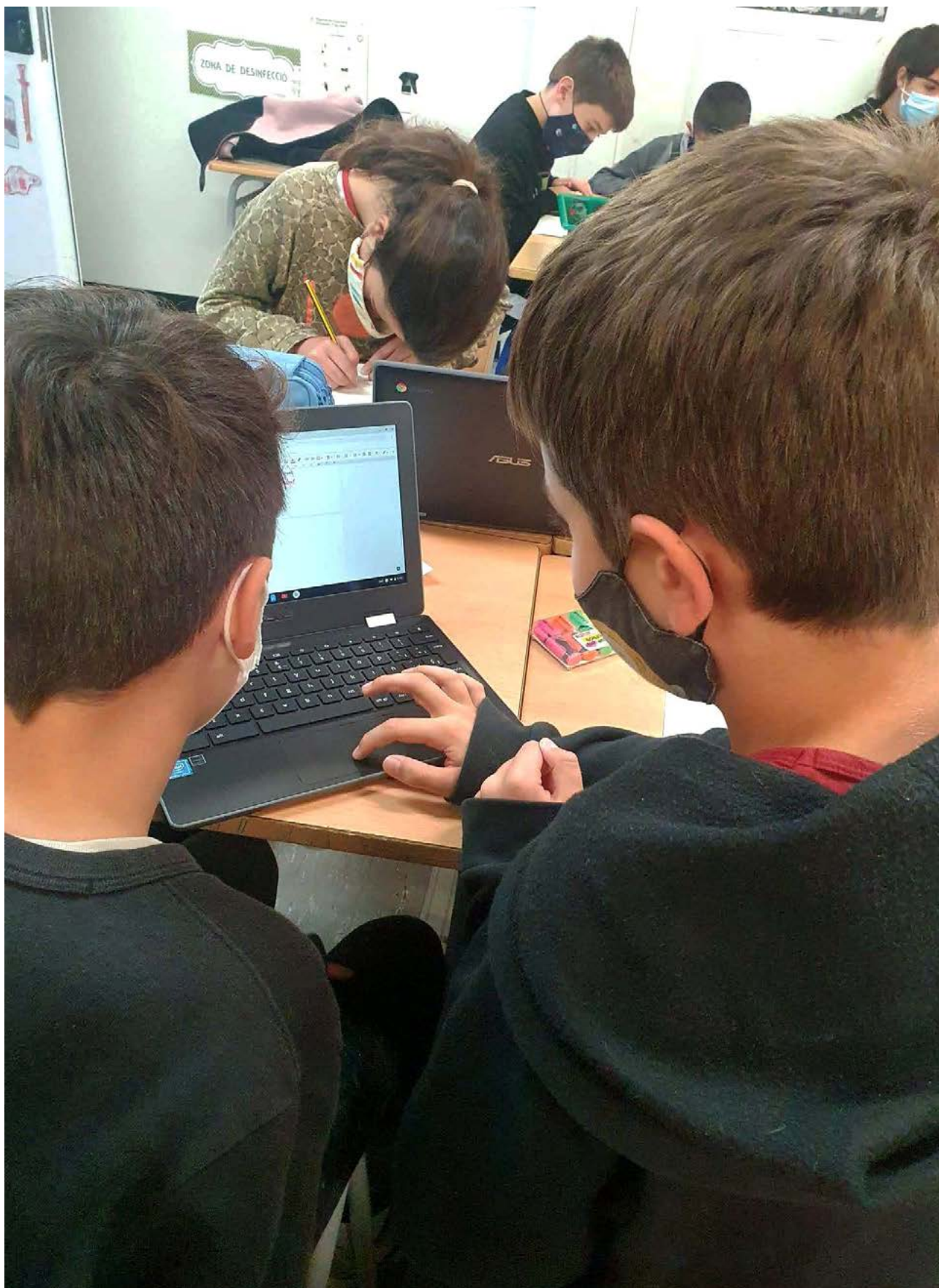
Alumnes de l'Escola Els Ganxets de Reus, amb el projecte Chromifiquem els Ganxets .